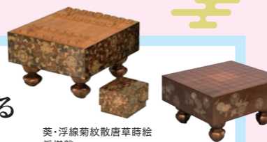
葵・浮線菊紋散唐草蒔絵 将棋盤

展示期間 5/14(火)~7/9(火) 葵・浮線菊紋散唐草蒔絵将棋盤、碁盤、双六盤 7/10(水)~9/8(日) 菊折枝蒔絵将棋盤