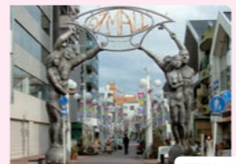
大曽根商店街・ 大曽根本通商店街

ショッピング・グルメ・フォトジェニックなど名古屋の魅力が詰まった名古屋最大の繁華街。南に少し行くと約1,200店が軒を連ねる「大須商店街」があります。