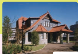
文化のみち 二葉館

1615年(慶長20)、徳川家康によって建てられた名古屋城。黄金の鯉を頂く天守閣、史上最大の延床面積を誇った大天守、絢爛豪華な本丸御殿は必見です。