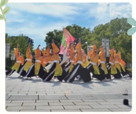
※写真・イラストはイメージです。

予告 雨天中止 【日時】11月3日[日] 【場所】美術館前広場 につぼんど真ん中祭りに出演した快踊乱舞。今年のテーマは徳川園です。旅人をテーマにした素晴らしい踊りと一緒に旅をしてみませんか