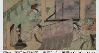
国宝 源氏物語絵巻 東屋(一) 展示:10/22～11/4

一般 1,600円 高大生 800円 小中生 500円 ※20名様以上の団体は一般200円、その他100円割引 ※毎週土曜日は高校生以下入館無料