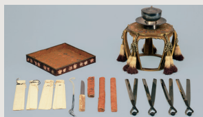
鬢曾木道具 江戸時代 17世紀

将軍家との橋渡し役となり、尾張徳川家の繁栄の基礎を築いた千代姫の生涯を振り返ります。