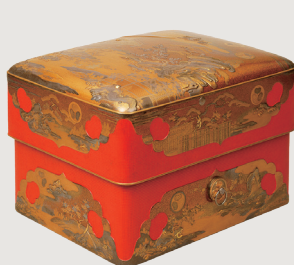
【国宝】初音蒔絵大角赤手箱 江戸時代 寛永16年(1639)

開館90周年の幕開けを飾るにふさわしい、黄金に輝く精緻で豪華な大名婚礼調度、国宝「初音の調度」全点が一堂に会します。