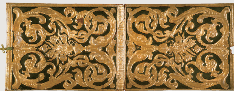
金唐草鏡覆 ハンス・ル・メール作 オランダ 17世紀