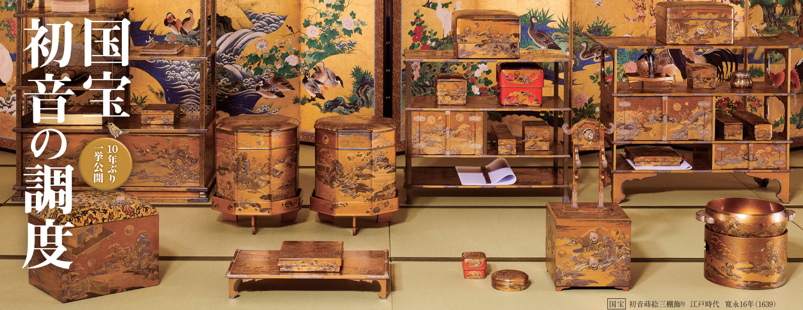
【国宝】初音蒔絵三棚飾り 江戸時代 寛永16年(1639)

国宝「初音の調度」。それは、徳川美術館が所蔵する1万件あまりの多彩な所蔵品の中でも一際、輝きを放つ、世界に誇る不朽の名品です。国宝「初音の調度」は寛永16年(1639)、3代将軍徳川家光の長女・千代姫(1637~98)が、尾張徳川家2代光友に嫁ぐ際の婚礼調度として詠えられました。明治維新や第二次世界大戦などの逸失の危機を乗り越え、計70件が現在まで伝わっており、質・量ともに類例のない、江戸時代を代表する蒔絵の名品として知られています。