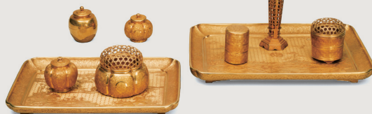
表面 【国宝】初音蒔絵文台・硯箱(部分) 江戸時代 寛永16年(1639) ※表記のない作品は全て霊仙院千代姫(尾張徳川家2代光友正室)所用 徳川美術館蔵