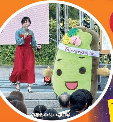
昨年のイベントの様子