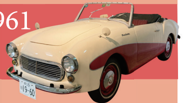
1961 ダットサン フェアレディ 1200 ※日本自動車博物館 所蔵