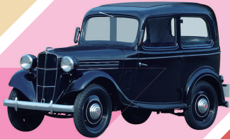
1937 ダットサン16型 セダン