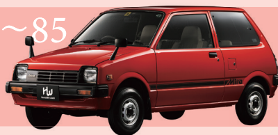
1982~85 ダイハツ ミラ