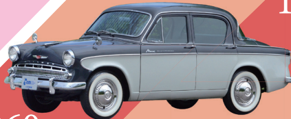
1960 いすゞ ヒルマンミンクス