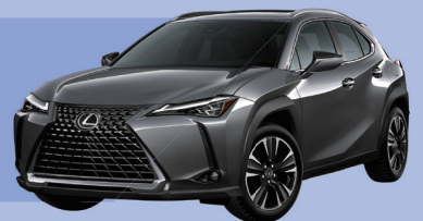
2021 レクサス UX250h