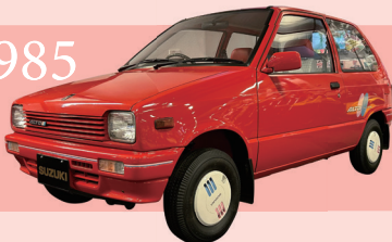
1985 スズキ アルト 麻美スペシャル