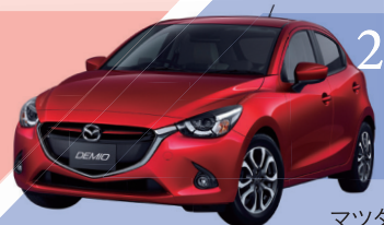
2014 マツダ デミオ ※10月2日(水)~8日(火)の期間は展示しておりません。