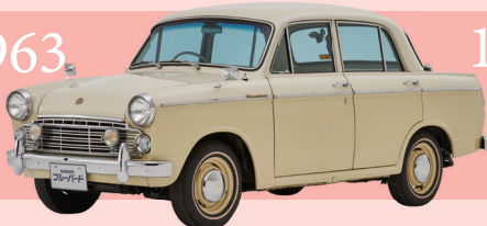
1963 ダットサン ブルーバード 1200 ファンシーデラックス