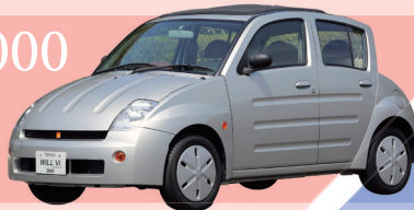
2000 トヨタ Will Vi