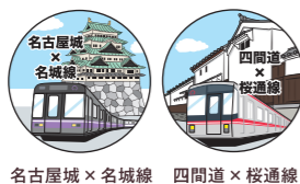
名古屋城 × 名城線 四間道 × 桜通線