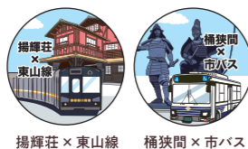
揚輝荘 × 東山線 桶狭間 × 市バス