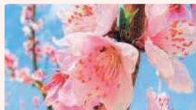
モモ | 3月下旬～4月上旬