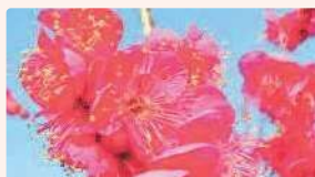
ウメ | 2月中旬～3月中旬

3月から4月にかけて、順次園内を彩る ウメ、アンズ、スモモ、アーモンド、モモ、 ナシの花をお楽しみいただけます。