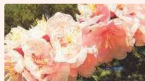
アンズ | 3月上旬～中旬