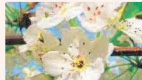
ナシ | 4月上旬～中旬