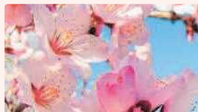
アーモンド | 3月中旬～下旬