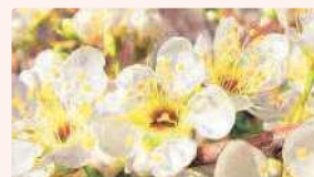
スモモ | 3月中旬