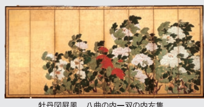
牡丹図屏風 八曲の内一双の内左隻