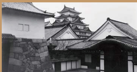
国宝時代の天守閣と本丸御殿

本丸御殿は、日本を代表する近世書院造の建造物で、総面積 3,100 m 2 、13棟の建物で構成されます。優美な外観とともに、室内は山水花鳥などを画材とした障壁画や飾金具などで絢爛豪華に飾られ、建築・絵画・美術工芸史において高く評価されています。城郭建築における国宝第1号(昭和5年)であり、世界に誇ることができる城郭御殿です。平成30年の完成公開では、江戸幕府将軍が宿泊するために建造された、最も豪華絢爛な「上洛殿」や「湯殿書院」などを公開します。