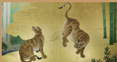
竹林豹虎園(復元模写)

名古屋城には江戸時代の文献や、昭和戦前期の古写真、実測図など豊富な史料が残されています。全国的に見られる城郭建築の復元の中で、最も実証的で忠実な復元が可能になったのは、これら第一級の史料があったからに他なりません。復元にあたっては、旧来の工法や材料を採用し、伝統技術や技法を受け継ぐとともに復元過程を広く公開し、先人の技や知恵を未来へと継承することを目指しています。