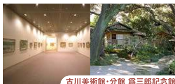
古川美術館・分館 為三郎記念館