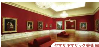
ヤマザキマザック美術館