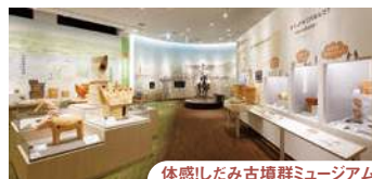
体感!しだみ古墳群ミュージアム