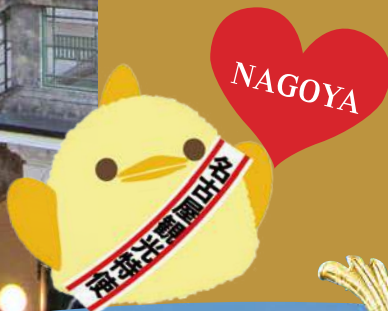
名古屋観光大使 ぴよりん